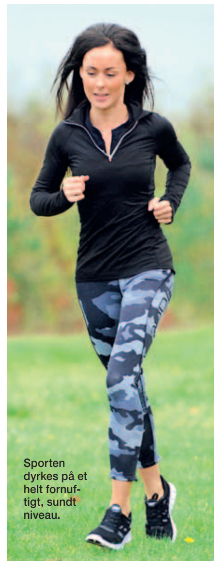
Sporten dyrkes på et helt fornuftigt, sundt niveau.